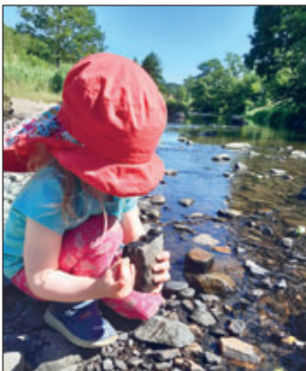
Bei einem genauen Blick ins Gewässer, kann man vieles entdecken.

Weitere Tiere, die im Wasser leben und nicht auf den ersten Blick zu entdecken sind, sind Wasserwanzen, Strudelwürmer, Käfer, Schnecken, Muscheln und Bachflohkrebse. Sie alle sind wichtiger Bestandteil des Nahrungsnetzes und erfüllen Ihre Aufgabe für einen gesunden Bach.