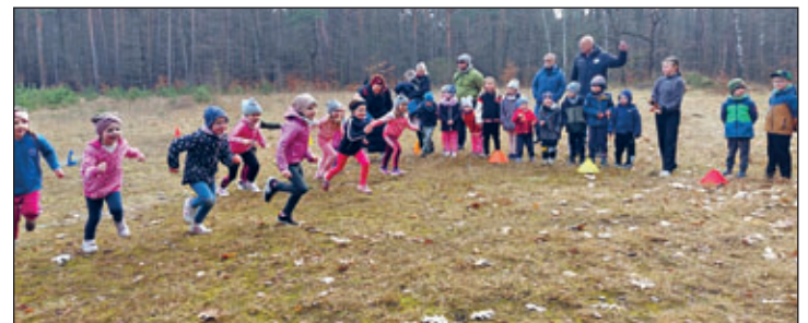
Im Foto der Start der Schulanfängerinnen des Jahres 2027