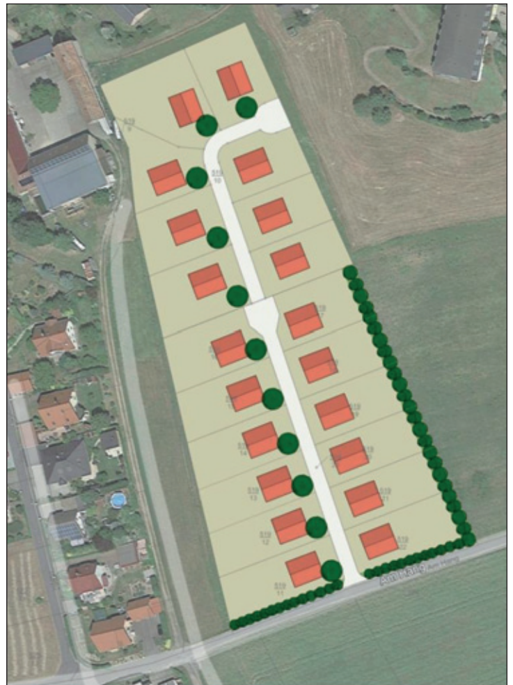
Übersichtsplan Geltungsbereich Bebauungsplan „Wohnbebauung Am Hang II Schönfeld, 2. BA“