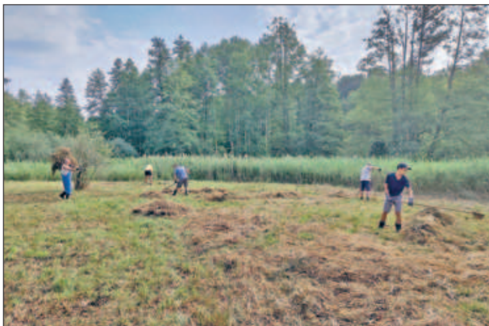
Beräumung des Mahdgoods auf der Orchideenwiese Kraußnitz

Impressum – Herausgeber: Gemeindeblatt Lampertswalde und Schönfeld, Herausgeber: Gemeindeverwaltung Schönfeld, Bürgermeister Falk Lindenau, Straße der MTS 11, 01561 Schönfeld. Gemeindeverwaltung Lampertswalde, Bürgermeister René Venus, Ortrander Straße 2, 01561 Lampertswalde