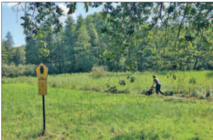
Mahd der Orchideenwiese Kraußnitz