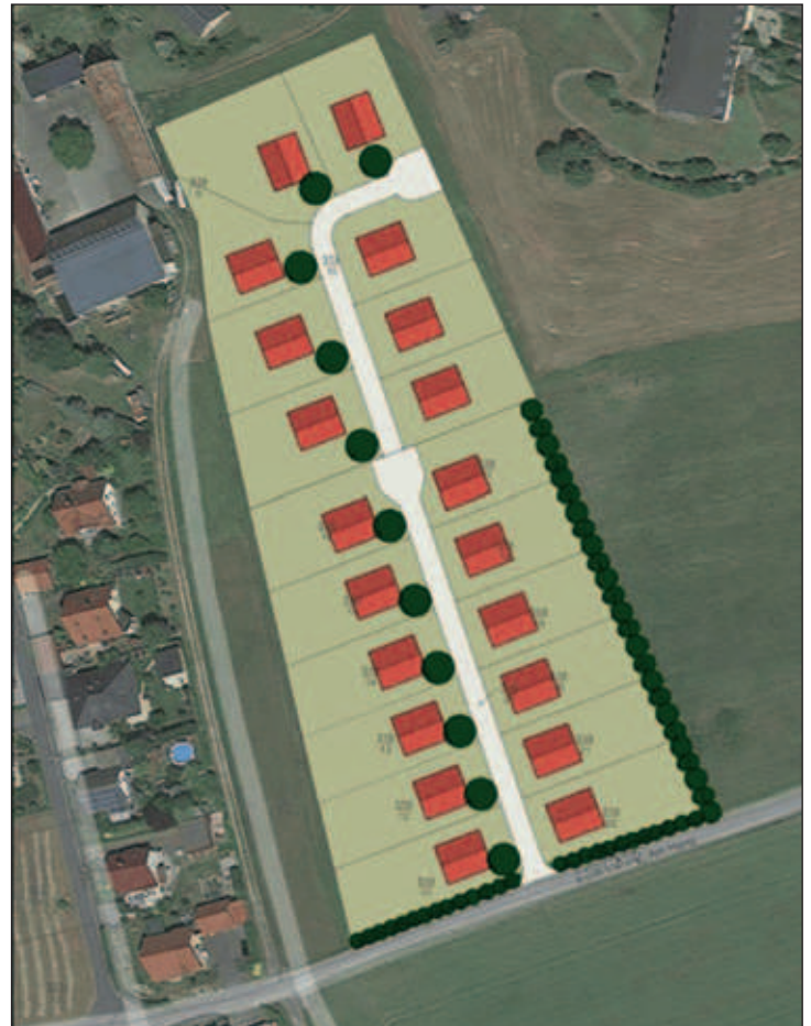
Übersichtsplan Geltungsbereich Bebauungsplan „Wohnbebauung Am Hang II Schönfeld, 2. BA“