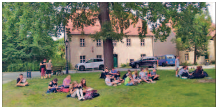
Zeichnen vor dem Kirchgebäude in Ruhland