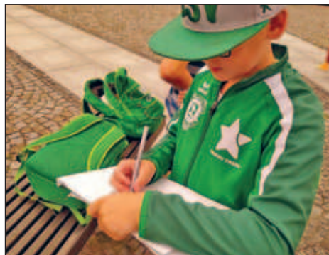
Gegenseitiges Zeichnen am Brunnen

Die liebevoll vorbereiteten Zimmer und Willkommensgeschenke seitens Ihrer Klassenlehrerinnen dürften das Eis zum Schmelzen gebracht haben. Das schöne warme Wetter hatte aber auch seine „Schattenseiten“, so dass sich das Schulgebäude sehr aufheizte und das Lernen schwierig wurde. Aus diesem Grund wurde im Sommerstundenplan gelernt. Die flexiblen Pläne zum Ankommen und gemeinsam Starten hatten viel Spielraum für Teamtrainings und Ausflüge. So hat zum Beispiel die 6a einen Ausflug am Donnerstag unternommen, der allerdings auf Grund einer Störung des Bahnverkehrs nicht nach Dresden in die Gemäldegalerie führte, sondern spontan mit vielen Zeichenübungen in der Umgebung verbracht wurde.