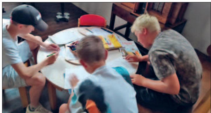
Zeichnen in dem Kirchgebäude in Ruhland