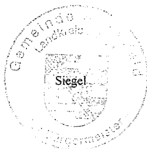
Falk Lindenau Bürgermeister der Gemeinde Schönfeld im Auftrag der Gemeinde Lampertswalde