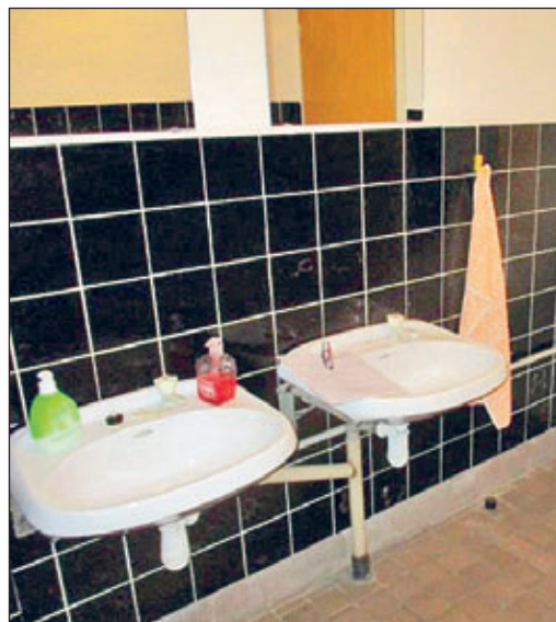
Vor und nach dem Umbau