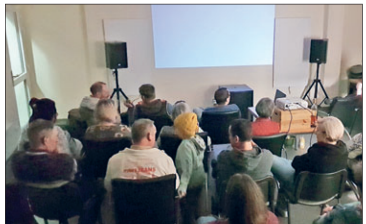
Bröbnitzer warten gespannt auf den Überraschungsfilm

Lange haben die Bewohnerinnen und Bewohner von Bröbnitz darauf gewartet. Dann war es soweit. Ihr Dorfgemeinschaftshaus wurde endlich saniert. Am 5. Januar 2024 fand die Einweihungsfeier statt. Mit einem größeren Innenraum, modernen Sanitäranlagen und einer funktionsfähigen Heizung bietet der ehemalige Konsum des kleinen Ortes ab sofort eine Möglichkeit, sich in gemütlicher Atmosphäre zu treffen, auszutauschen oder ausgelassen zu feiern. So organisierte kurzerhand der Ortschaftsrat für den 24. Februar einen gemeinsamen Filmabend. 23 Interessierte kamen zusammen. Das ist eine erfreuliche Zahl für einen Ort mit rund 80 Einwohnern. Gezeigt wurde eine skandinavische Komödie, in der es auf groteske Art und Weise um menschliche Grundbedürfnisse, wie die Zugehörigkeit zu einer Familie geht. Der schwarze Humor kam bei den Zuschauern gut an. Im Anschluss an den Film tauschten sich die Gäste dabei nicht nur über die Inhalte aus. Auch allgemeine Themen fanden Anklang. „Die hohe Resonanz auf die kurzfristige Einladung zeigt, dass Dorfgemeinschaftshäuser ein wichtiger Bestandteil für soziales und kulturelles Miteinander im ländlichen Raum sind. Gemeinschaft braucht Räume.“, so Ortschaftsratsvorsitzende Kathrin Mattheus. Die Filmvorführungen in Bröbnitz sollen in Zukunft in regel-