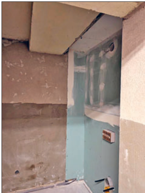
In einen alten Lagerraum wurde die neue behindertengerechte Toilette eingebaut

Diese Baumaßnahme wurde mitfinanziert durch Steuermittel auf der Grundlage des von den Abgeordneten des Sächsischen Landtags beschlossenen Haushaltes