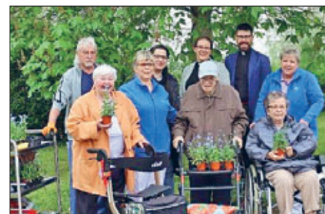
Im vergangenen Jahr haben sich u. a. Bewohnerinnen und Bewohner des Seniorenhauses „Albert Schweitzer“ über die Blumenspende gefreut.