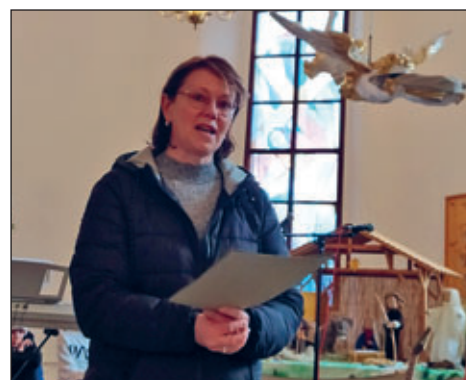
Frau Scholz hält eine feierliche Rede.