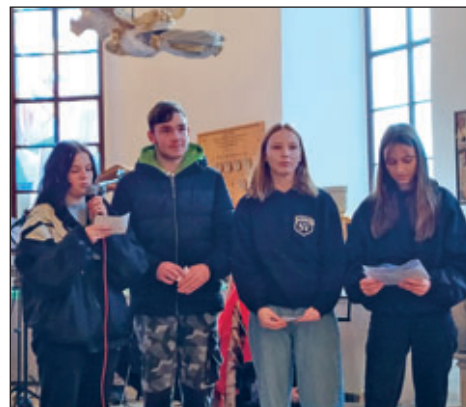
Der Schülerrat, der uns durch das Programm leitete.

Wir bedanken uns als Schule bei allen am Programm Beteiligten. Unser besonderer Dank gilt dabei der Kirchgemeinde Schönfeld, die uns die Räumlichkeit zur Verfügung gestellt hatte.