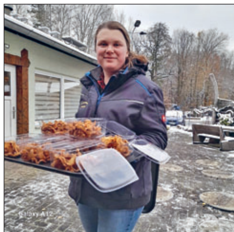
Projektwoche Klasse 5