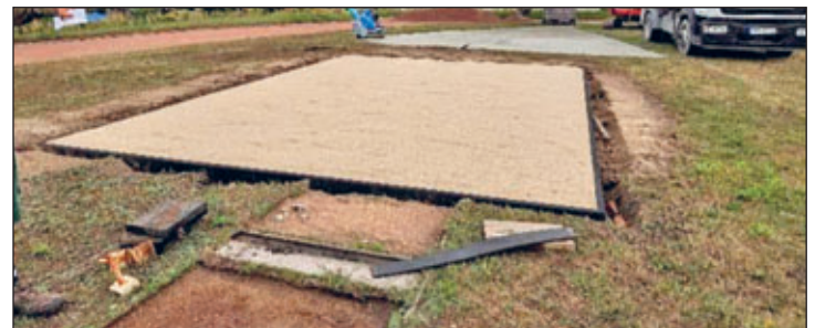
neue Sportanlage während der Bauphase

Durch die Unterstützung vom Dresdner Heidebogen eV sowie durch das Landratsamt Meißen, Kreisentwicklungsamt wurde für die Gemeinde Schönfeld diese Baumaßnahme möglich.