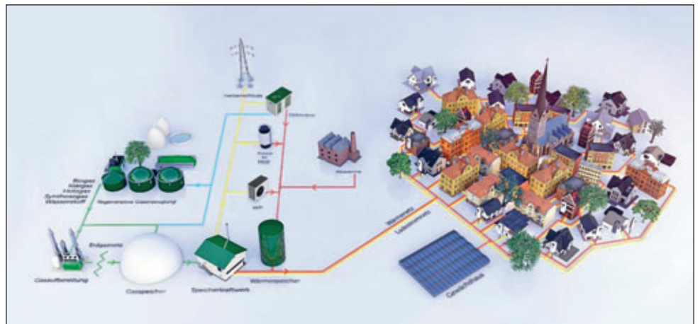
konzeptionelle Darstellung Wärmeversorgungsprojekt Thendorf

Folgen Sie dem QR-Code für weitere Informationen.