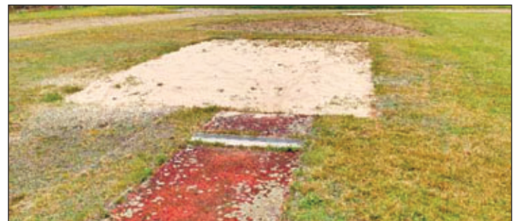
Alte Sportanlage vor der Instandsetzung