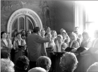
Winzerchor Spargebirge e.V. Meißener Auftritt im Schloss

Das Team des Fördervereins begrüßt seine Gäste.