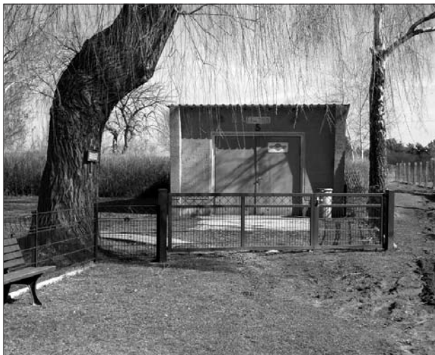
Das alte Feuerwehrgerätehaus 1984 erbaut in der VMI (Volksmasseninitiative).