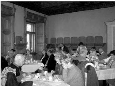
Schlosscafé Jeden Sonntag ab 14.00 Uhr geöffnet.

Bei zauberhaften Sonnenschein starteten wir am Sonntag dem 6. März 2011 unsere Schönfelder Traumschloss Saison.