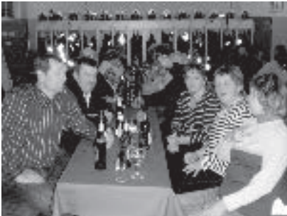
Gemeinsame Feierstunde zum 5-jährigen Bestehen des Feuerwehrgerechtes in Schönfeld.