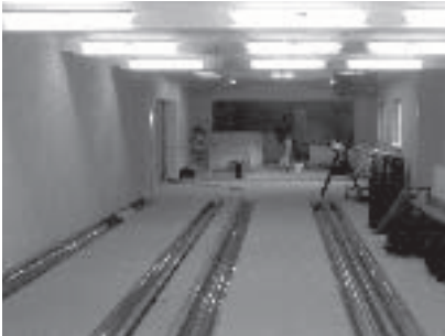
Bowlingbahn im Gasthof „Palmbaum“ in Linz kurz vor der Fertigstellung.