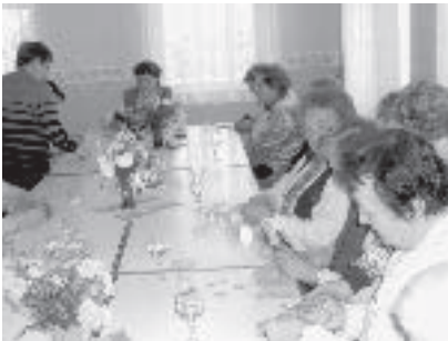
Gemeinsamer Bastelnachmittag unserer Seniorinnen im Kulturraum in Linz.